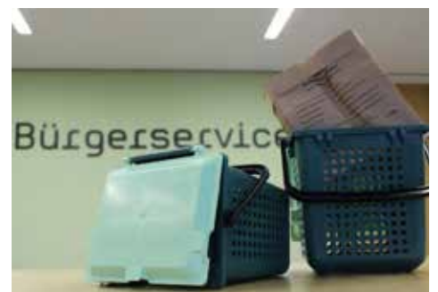
Zur Vermeidung von Plastik im Biomüll gibt es eine tolle Alternative