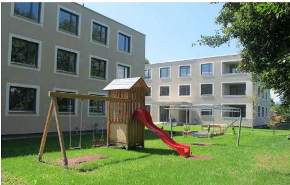
Vom Spatenstich zur fertigen Wohnanlage.